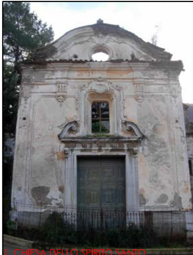
1. CHIESA DELLO SPIRITO SANTO