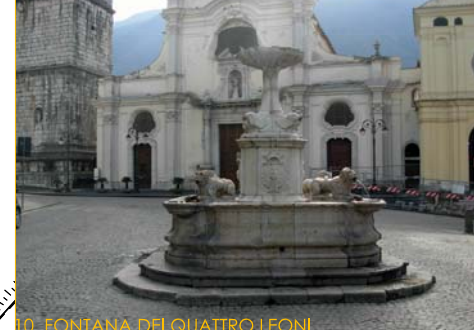
10. FONTANA DEI QUATTRO LEONI