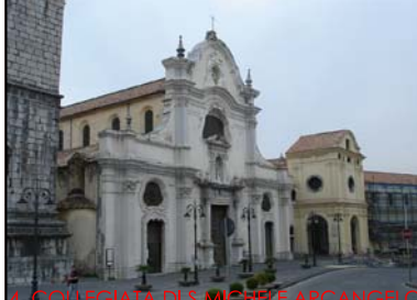
4. COLLEGIATA DI S. MICHELE ARCANGELO