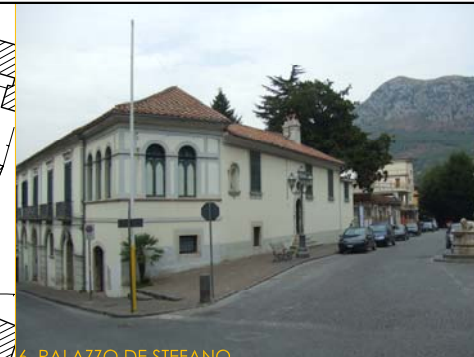
6. PALAZZO DE STEFANO