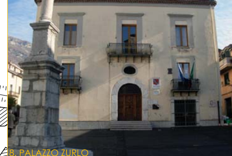
8. PALAZZO ZURLO