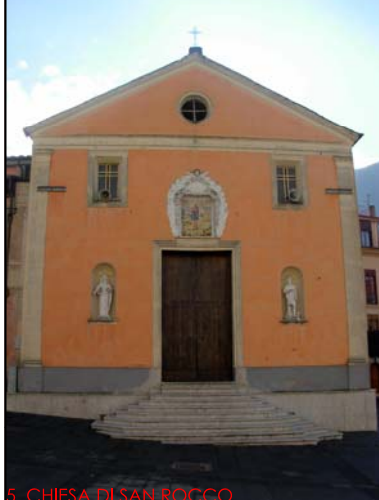
5. CHIESA DI SAN ROCCO