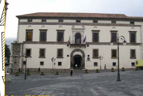
7. PALAZZO ORSINI