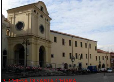
3. CHIESA DI SANTA CHIARA