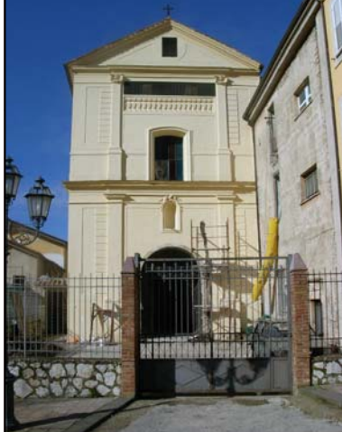
2. CHIESA DELL'ADDOLORATA