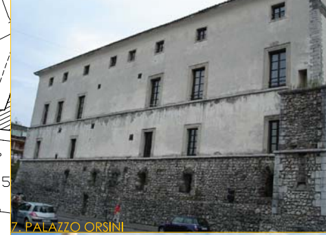
7. PALAZZO ORSINI